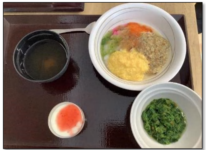
<全粥・ミキサー食>